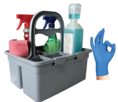
Strumenti per pulire